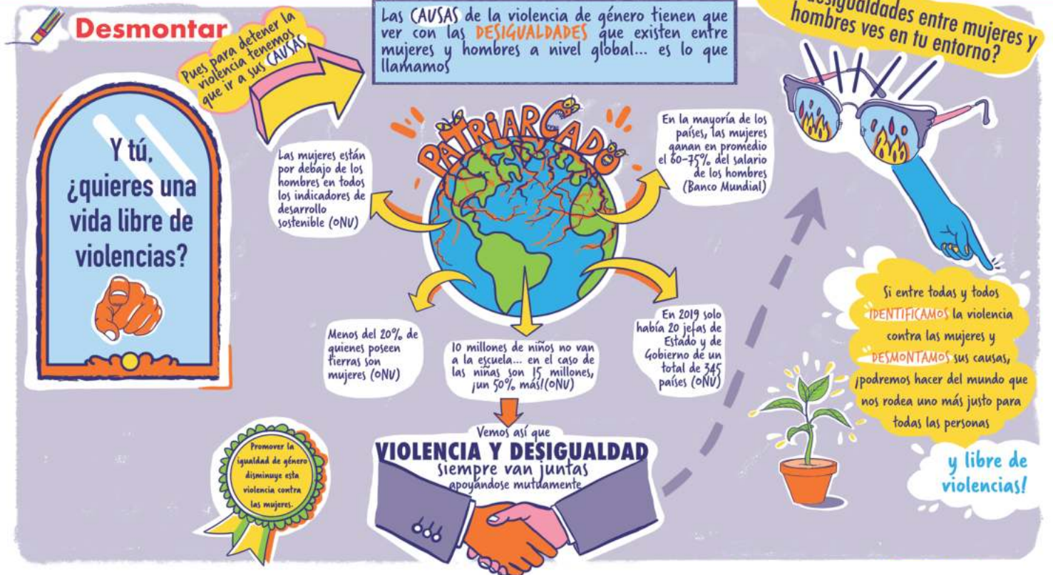
Panel del paso de Desmontar del eje de Prevención de Violencias Machistas de la Exposición TOCA IGUALDAD, ¡TOCA COEDUCAR!.

nos ayudan a “romper los esquemas” que hasta entonces dábamos por inamovibles. Y porque solo colectivamente podremos dar lugar al cambio estructural y sistémico que necesitamos para poder vivir en mundos libres de violencias machistas.