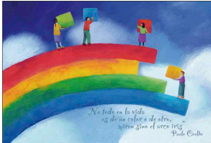
ILUSTRACIÓN: MAURICIO MAGGIORINI

Las organizaciones LGTB, desde su creación, han centrado sus esfuerzos en eliminar toda la legislación que había justificado su