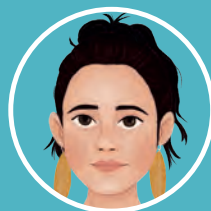
Diciembre 2022 NATALIA SANCHA Fotoperiodista onubense